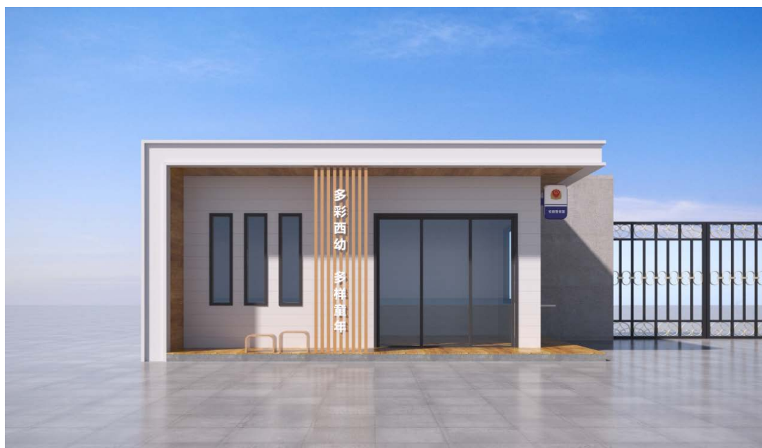
与门卫值班室组合搭配侧视效果图